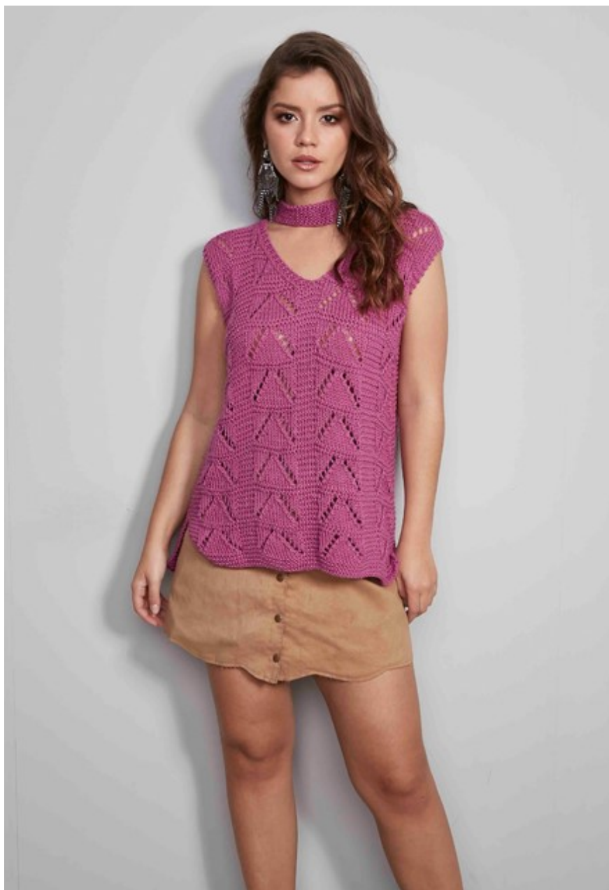
Blusa Maxcolor Violeta